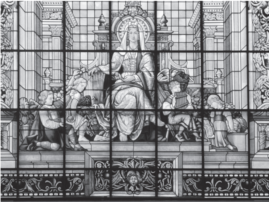
Abb. 3: Fenster „Osten“ im Reichsgerichtsgebäude zu Leipzig (1895) (Detail), Foto: H. Lück