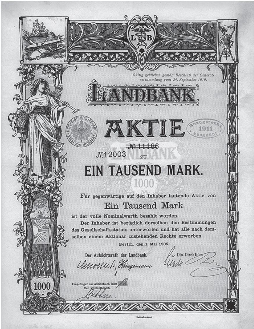
Abb. 4: Aktie der Landbank Berlin von 1905