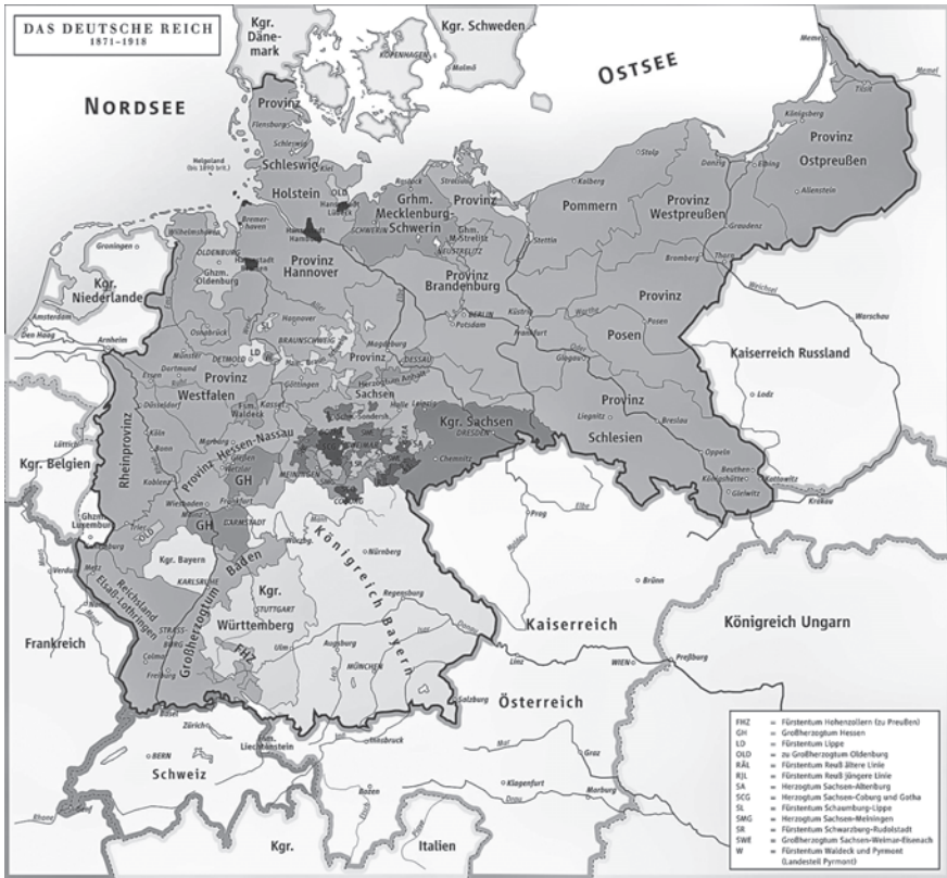
Abb. 2: Deutsches Reich 1871–1918 mit preußischen Provinzen